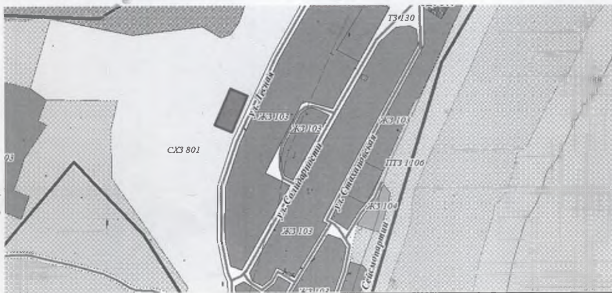
Схема размещения контейнерных площадок на территории Подымахинского муниципального образования. в п. Казарки