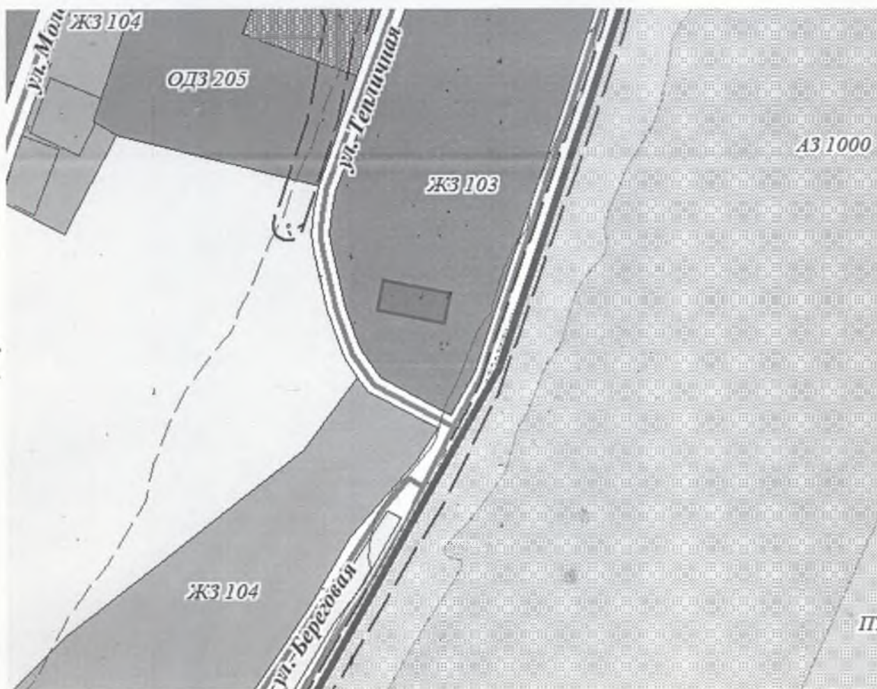
Схема размещения контейнерных площадок на территории Подымахинского муниципального образования. в п. Казарки